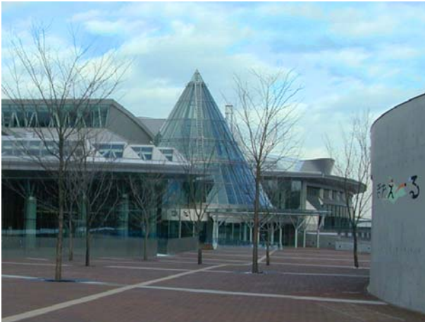
北海道立総合体育センター外観