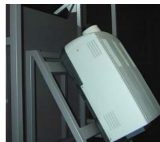
リア式プロジェクター